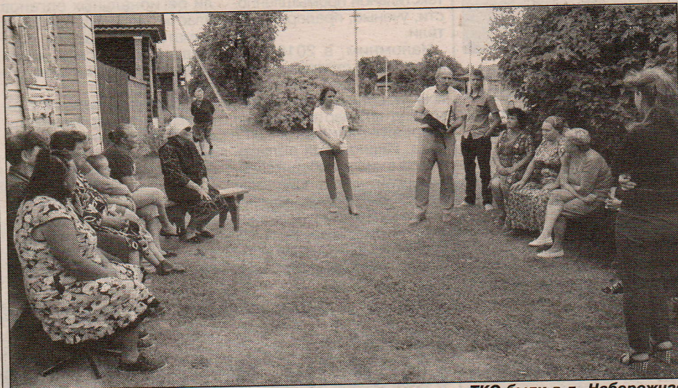
Особенно жаркие споры по вывозу ТКО были в д. Набережная